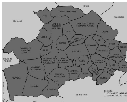
Ilustração 2 – Mapa de Vila Nova de Famalicão

Em termos rodoviários, Vila Nova de Famalicão é, também, zona de confluência de autoestradas, A3 (Porto – Espanha) e A7 (Vila Nova de Famalicão – Guimarães e Vila Nova de Famalicão – Vila do Conde/Póvoa de Varzim), com ligação ao IC1 (Porto – Valença), bem como por uma série de estradas nacionais que fazem ligação às cidades vizinhas de Barcelos, Trofa, Braga, Póvoa de Varzim, Guimarães e Santo Tirso. Vila Nova de Famalicão tem uma localização estratégica bastante importante, situando-se a 80 km da Galiza e a cerca de 30 km do Aeroporto Internacional Francisco Sá Carneiro e do Porto de Leixões.